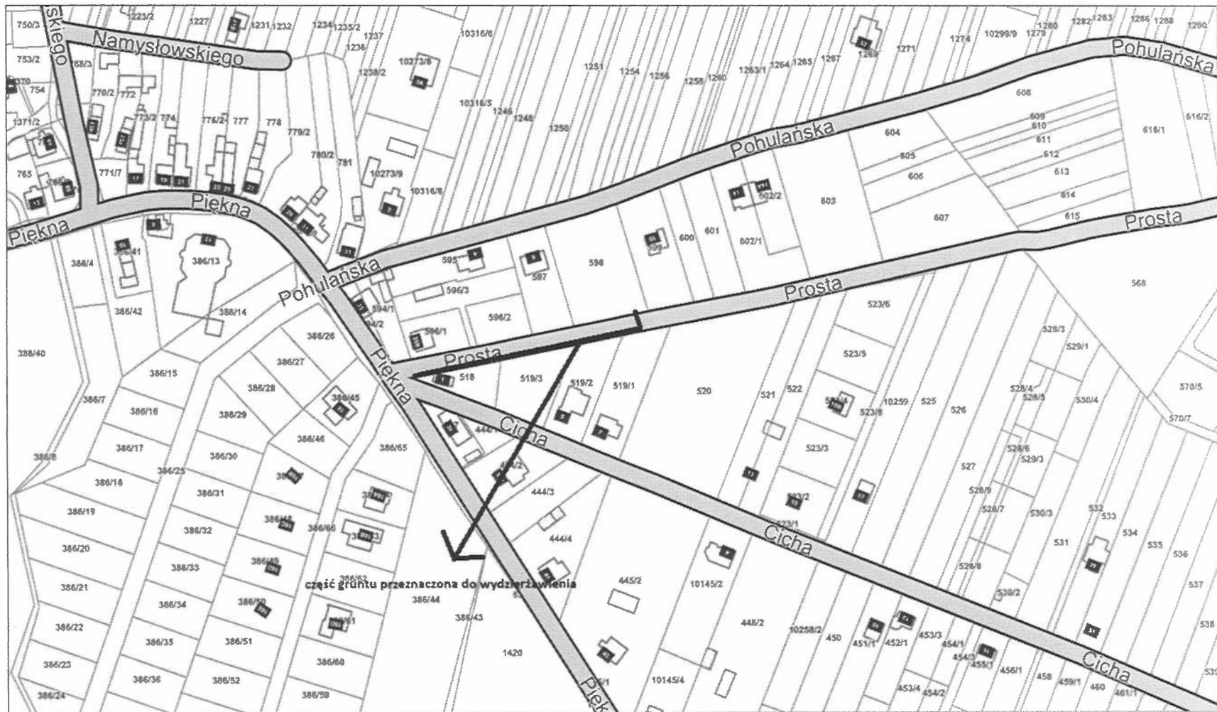
Załącznik graficzny do projektu uchwały w sprawie wyrażenia zgody na zawarcie umów dzierżawy w trybie bezprzetargowym poz. 3