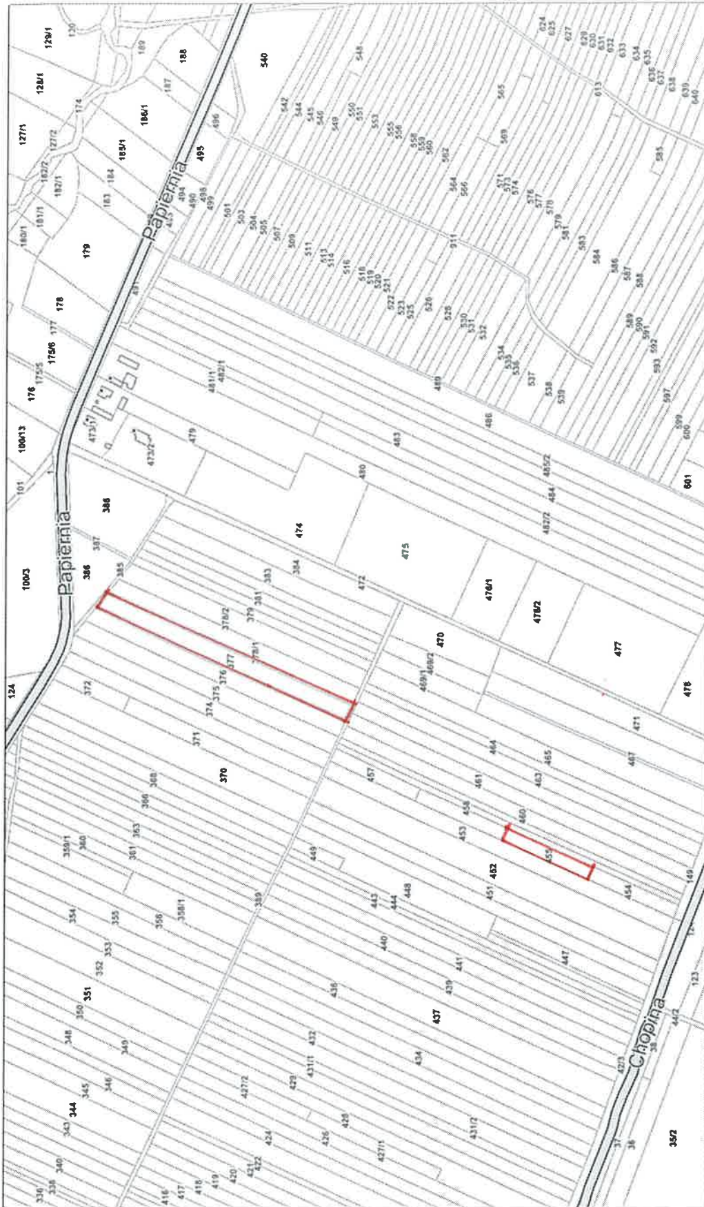
Załącznik graficzny do projektu uchwały w sprawie wyrażenia zgody na zawarcie umowy dzierżawy z dotychczasowym dzierżawcą