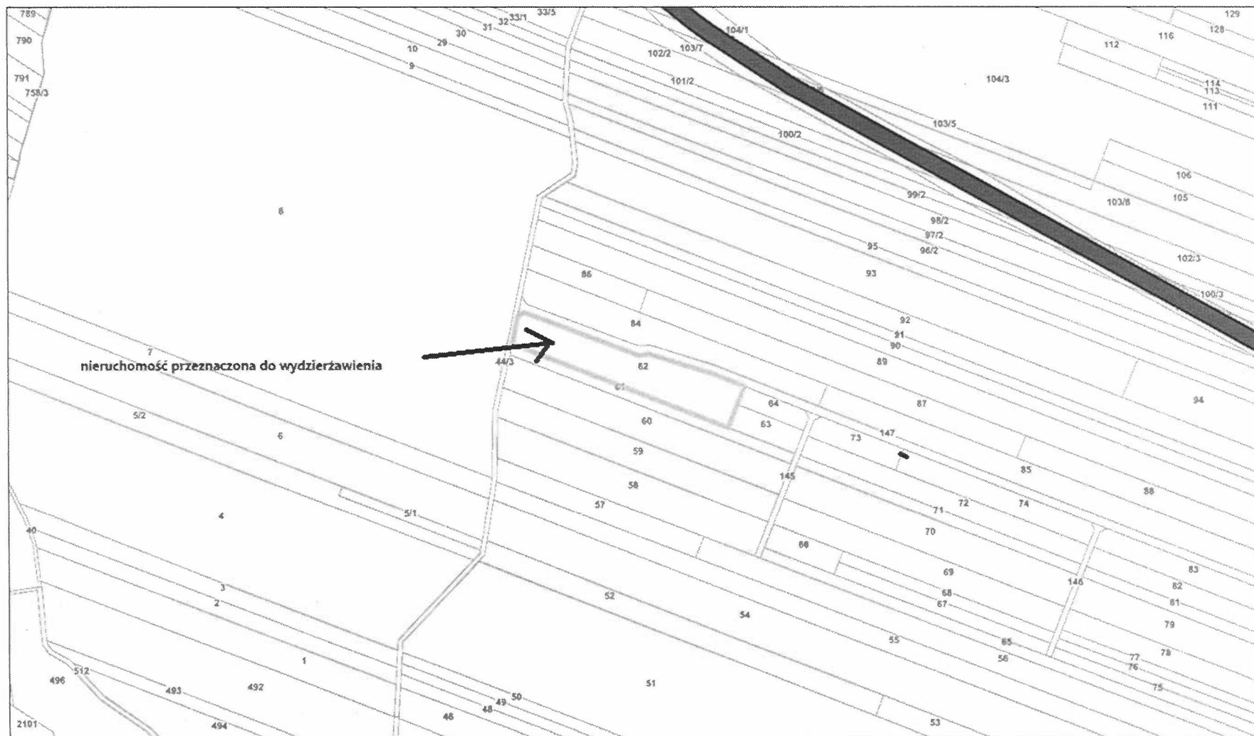
Załącznik graficzny do projektu uchwały w sprawie wyrażenia zgody na zawarcie kolejnych umów dzierżawy z dotychczasowymi dzierżawcami dot. pkt 8